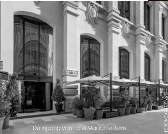
De ingang van hotel Madame Réve