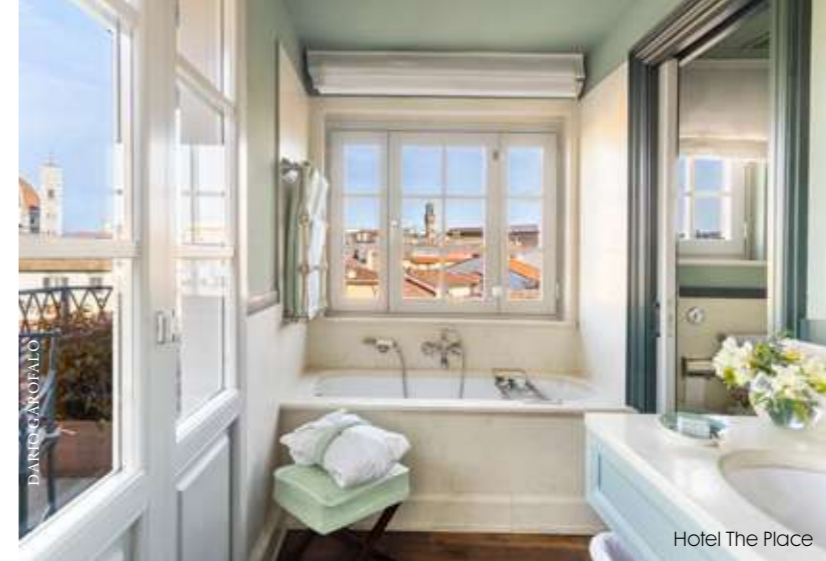
Hotel The Place