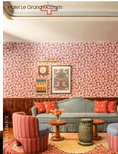
Hotel Le Grand Mazarin

La Grande Épicerie de Paris • Buly 1803 • Astier de Villatte