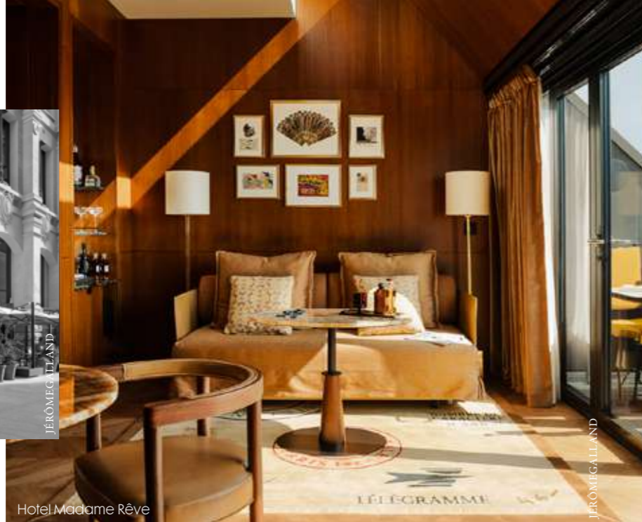
Hotel Madame Réve