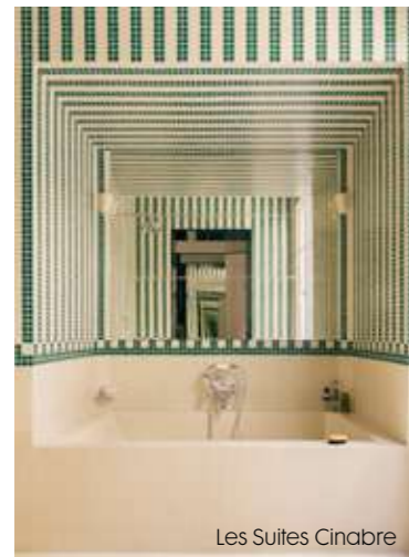
Les Suites Cinabre