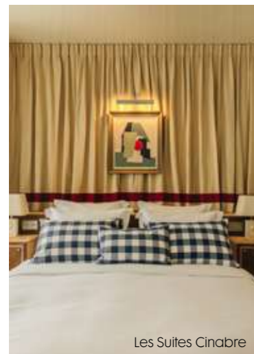
Les Suites Cinabre